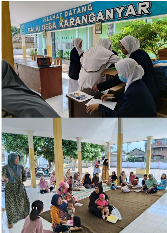
Gambar 1. Dokumentasi Pelaksanaan Pengabdian